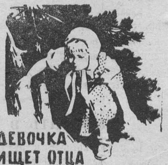
ДЕВОЧКА ИЩЕТ ОТЦА

Начало сеансов: в 9, 10-50, 12-40, 2-30, 4-20, 6-10, 8, 9-50 вечера.