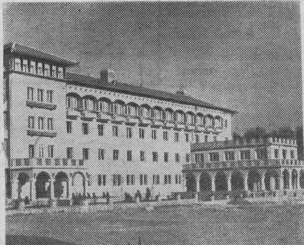
Новый дом отдыха для крестьян в Костендиле

Артели «Правда» требуются: слесарь по ремонту швейных машин и велосипедов, приемщик в са-