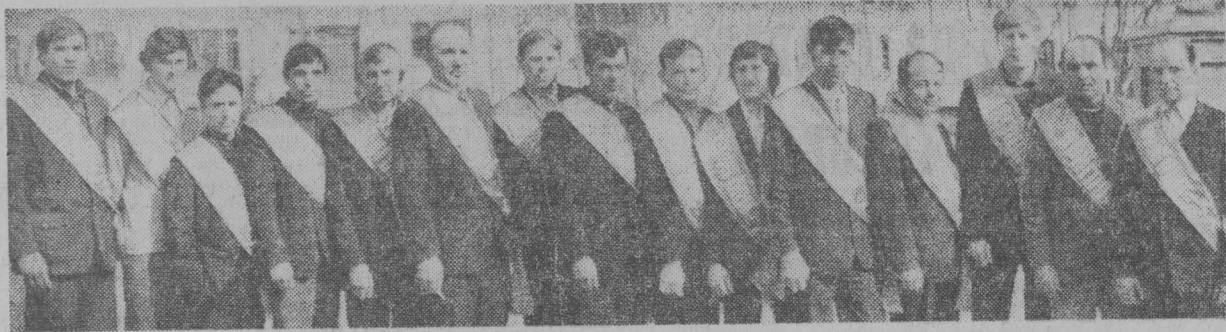
Хорошая традиция существует на шахте имени Кирова: по итогам прошедшего года называть члены символической бригады, в состав которой входят лучшие горняки шахты. Недавно на шахте были на-