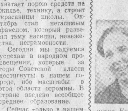
Знаете, как волнует человека труда высокая оценка! Вот с такого волнующего события начался для меня этот год по итогам республиканского соревнования в 1976 году мне было присвоено звание лучшей по профессии в отрасли. Оно придало мне новые силы, и 20 октября я завершил план трех лет пятилетки. Это мой трудовой подарок юбилею Советской власти и отклик делом на призыве Конституции СССР. Испытываю и большую радость не только за себя, но и за товарищей по труду. Ведь 28 работников нашего производства, или навстречу празднику, завершили план двух лет. Хотя сегодня наш комбинат переживает трудности, мы, текстильщики, верим в свои силы и добьемся, чтобы он встал в ряды передовых предприятий города.