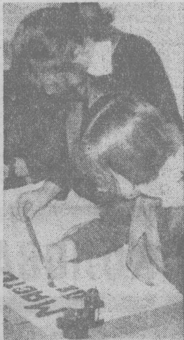
ПРОДЛЕННЫЙ ДЕНЬ В ШКОЛЕ № 46