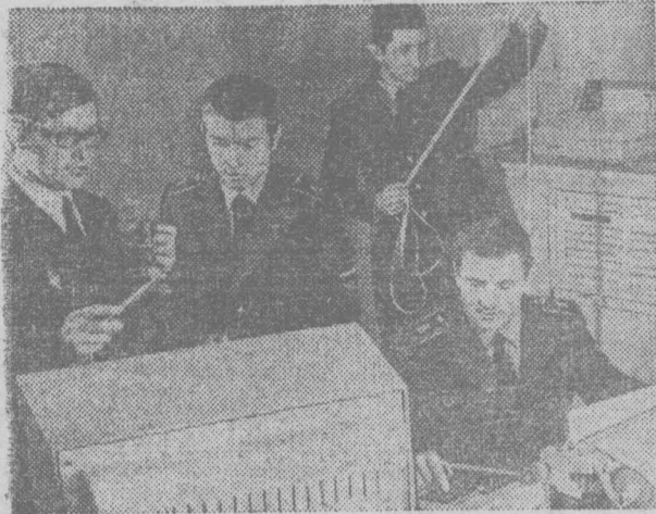
КАЗАХСКАЯ ССР. В городе Актюбинске открылось высшее летное училище гражданской авиации. На первый курс принято свыше трехсот курсантов. Будущие инженеры-пилоты изучают высшую математику, механику, физику, аэронауку и целый ряд других предметов.