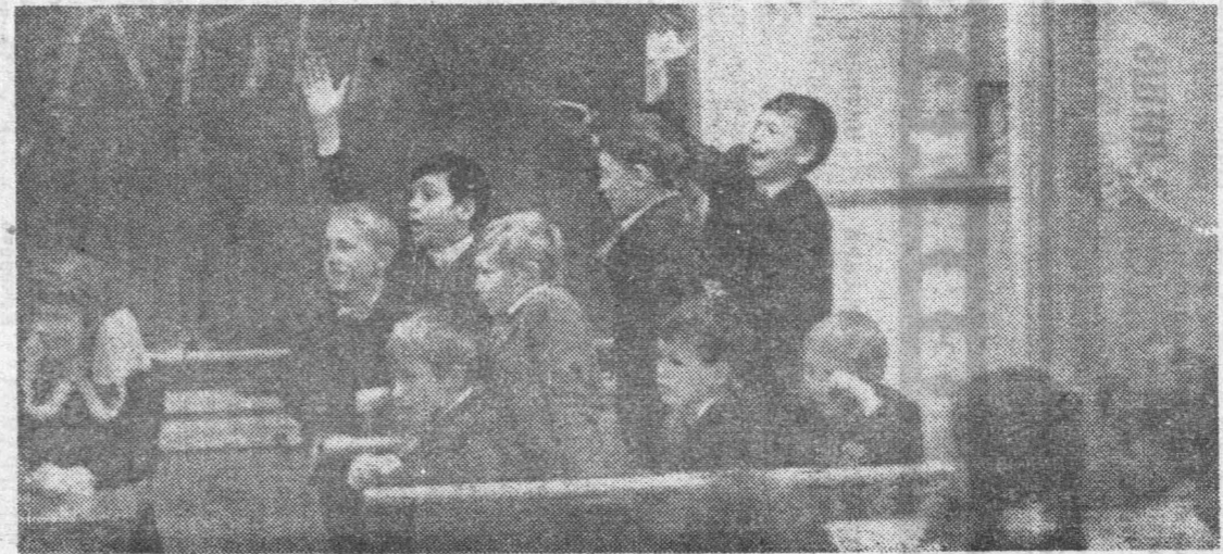
Никого из четвероклассников не оставил равнодушным КВН по литературе. Темой его были сказки — увлекательный для вчерашних малышей материал.

В отряде 7г класса прошел сбор «Знания нужны в жизни, как винтовка в бою». На нем состоялся серьезный разговор о важности знаний. Были приглашены родители. На сборе не было равнодушных.