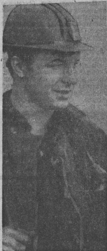
Горняки очистного участка № 7 шахты «Комсомолец» постоянно трудятся с нагрузкой на механизированный комплекс по 1200 и более тонн.

Г. САРАЕВ, электростроитель. Шахта «Кузнецкая».