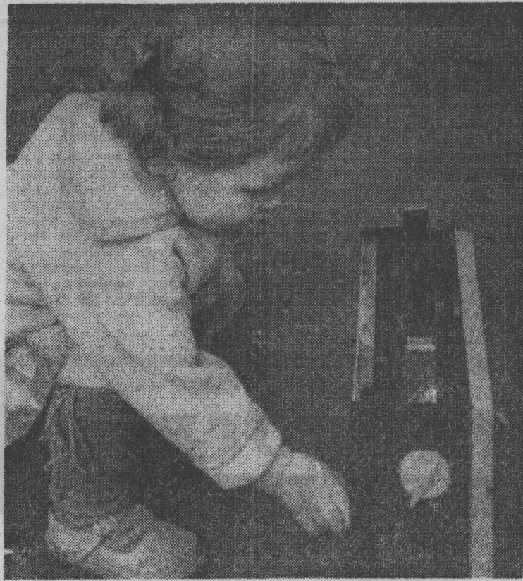
ФОТО САЛОН «ЛЕНИНСКОГО ШАХТЕРА»