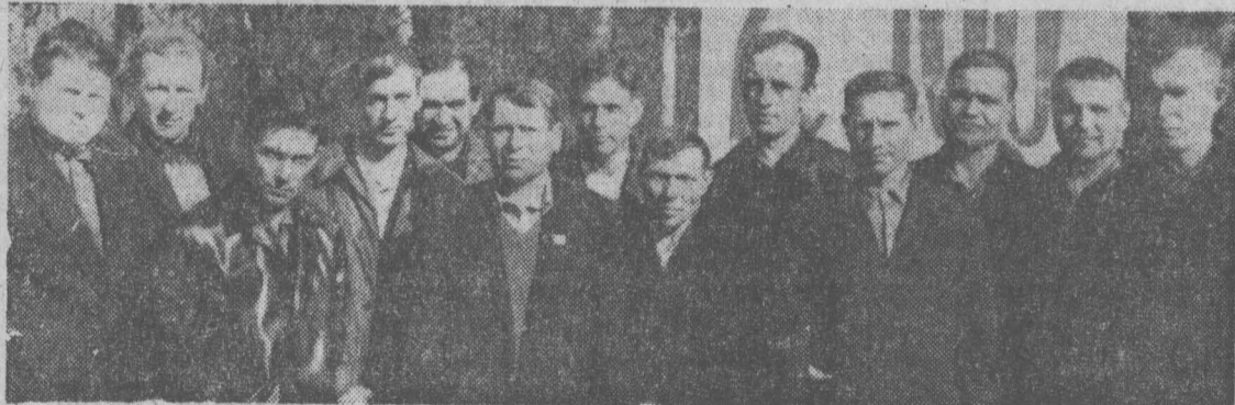
Более 130 тысяч тонн сверхпланового угля перевезли транспортники шахты «Польшаевская-2» в новой пятилетке.