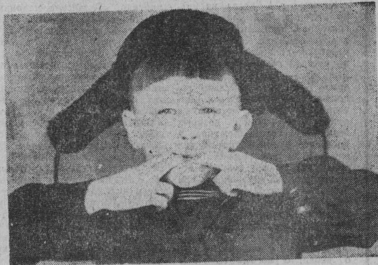
— А Я СОЛОВЕЙ-РАЗБОЙНИК

С сосулек капели Текут ручейком. На крыше растаял Под солнышком снег. Сосулек не стало, Ледяночек — нет.