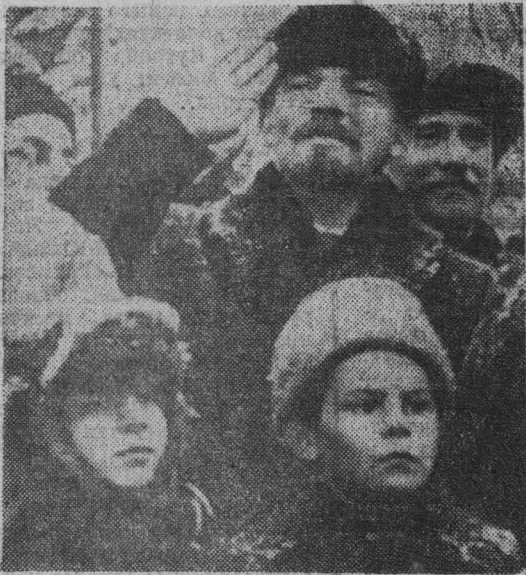
В. И. Ленин на Красной площади во время празднования второй годовщины Великой Октябрьской социалистической революции, Москва, 7 ноября 1919 года.