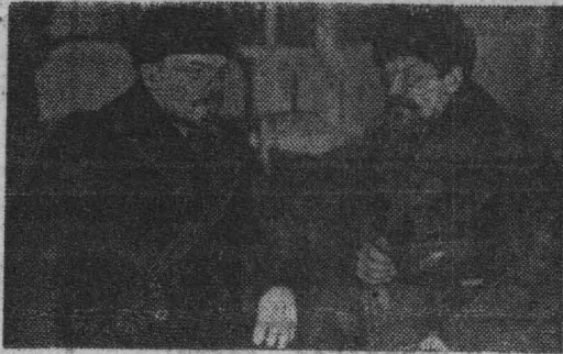
На снимке: В. И. Ленин и М. И. Калинин в Доме союзов во время работы I Всероссийского съезда трудовых казаков, Москва, 1 марта 1920 года.