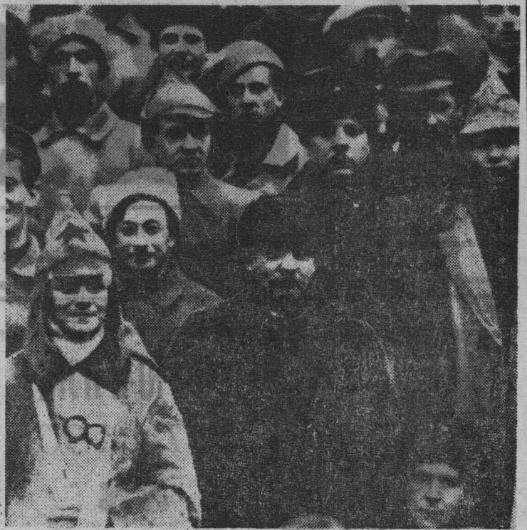
В. И. Ленин и К. Е. Ворошилов в группе делегатов X съезда РКП(б) — участников подавления Кронштадтского мятежа, Москва, март 1921 года.