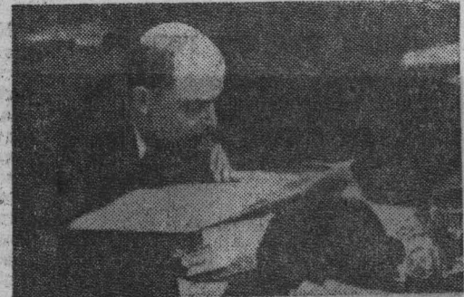
На снимке: В. И. Ленин в президиуме IX съезда РКП(б) в Сverdловском зале Кремля, Москва, март-апрель 1920 года.