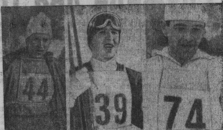
На соревнованиях по лыжному спорту в городе Штрбске-Плезе (Чехословакия) эти советские спортсмены стали чемпионами мира. Галина Кулакова выиграла гонку на 5 км с результатом 18 мин. 07.89 сек. Гарри Напалков в состязаниях на среднем трамплине прыгнул на 78,5 и 84 метра, заняв первое место. Вячеслав Веденин (справа) был первым в гонке на 30 км. Его результат — 1 час 39 мин. 48 сек.