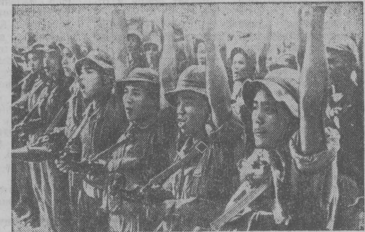
ЮЖНЫЙ ВЬЕТНАМ. Бойцы одного из подразделений Народных вооруженных сил освобождения перед выходом на боевое задание клянутся в верности родине, в непо-

Новый цветной широкоэкранный художественный фильм ОСВОБОЖДЕНИЕ Сеансы: 10, 5, 8, 20. ОСВОБОЖДЕНИЕ (1-я серия) Сеанс в 1 час. 20 мин. РАЗВЕДЧИКИ Сеанс в 3 час. 10 мин. ЦЕНТРАЛЬНЫЙ ДК ЦВЕТОК И КАМЕНЬ (2 серии). Сеансы: 2, 5, 8. «РОДИНА» Новый художественный фильм ПЕРЕСТУПИ ПОРОГ Сеансы: 11, 12, 50, 4, 5, 50, 7, 30, 9, 30. ПРИКЛЮЧЕНИЯ ТОЛИ КЛЮКВИНА Сеансы: 9, 30, 2, 30.