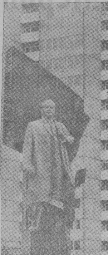
БЕРЛИН. Памятник Владимиру Ильичу Ленину был открыт недавно в столице ГДР. Он сооружен по проекту советского скульптора народного художника СССР Н. В. Томского.