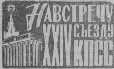
Фото и текст Д. Николаева

В ЧЕСТЬ XXIV съезда КПСС коллектив завода «Кузбассэлемент» взял дополнительные обязательства: выполнить пятилетний план производства товарной продукции к 10 октября 1970 года; изготовить и реализовать дополнительно товарной продукции на 100 тысяч рублей; за счет осуществления