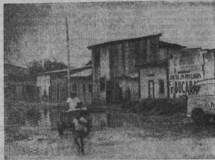
В Эквадоре все острее ощущается нехватка жилищ. Более половины населения Гуаякиля — крупнейшего города страны — живет в крайне тяжелых антисанитарных условиях, которые усугубляются в период дождей.

На снимке: на одной из улиц, где живет рабочая беднота.