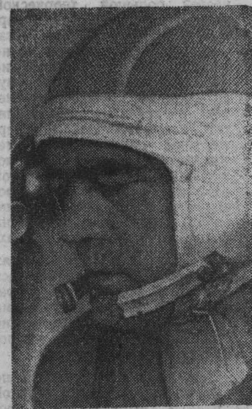
Командир космического корабля «Союз-9» А. Г. Николаев.