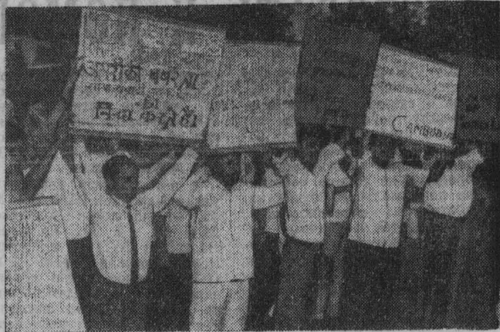
Общественность Индии решительно осуждает агрессию американо-сайгонской военизации в Камбодже. Во многих городах страны проходят мощные демонстрации протеста против вмешательства США во внутренние дела камбоджийцев.

В тираже на один разряд займа разыгрывается 9400 выигрышей на сумму 512560 рублей, в том числе выигрыши по 5000, 2500, 1000, 500, 100 и 40 рублей. Приобретайте облигации займа!