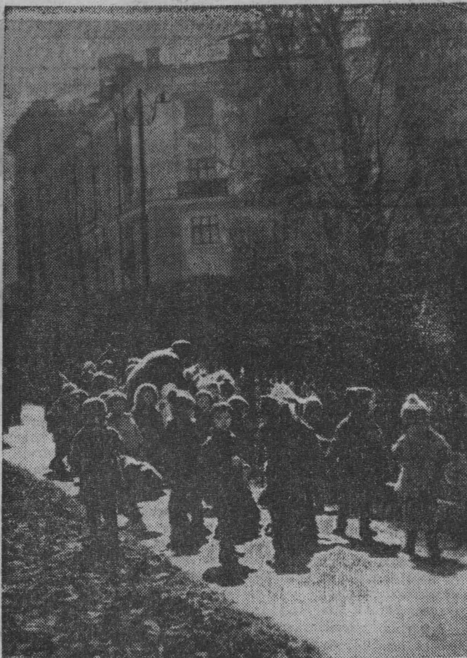
Фото и текст В. Даникова.

Шутки, улыбки и веселый смех. И все это — Весна!