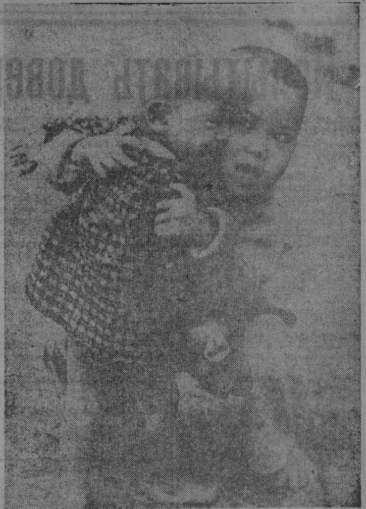
ЮЖНЫЙ ВЬЕТНАМ. Эти дети остались в живых после варварского истребления стариков, женщин и детей в южновьетнамской деревне Сонгми американскими солдатами. Снимки убитых запрещены для публикации Пентагоном.