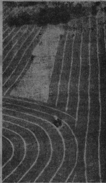
Эти четкие линии валков проложили механизаторы Славянского совхоза Кустанайской области. Ныне совхоз будет сдавать зерно в счет второго пятилетнего плана.