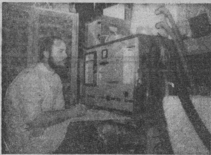
Советский врач Юрий Сенкевич — один из семи членов интернационального экипажа, возглавляемого норвежцем Туром Хейердалом, который совершит плавание из Северной Африки в Центральную Америку на небольшом корабле «Ра» из папируса. Юрий Александрович — бывший путешественник. Он провел год в составе советской экспедиции в Антарктиде. На снимке: Юрий Сенкевич на станции «Восток» в Антарктиде.