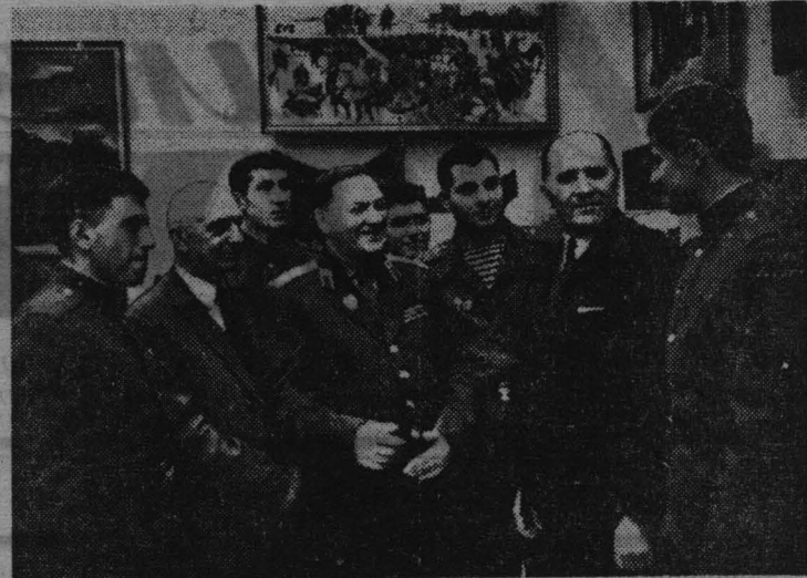
МОСКВА. В Центральном музее Вооруженных Сил СССР открылась выставка «Ленинский комсомол в боях за Родину», посвященная 50-летию ВЛКСМ.

В выступлениях коммунистов (а их выступило 11) критики было мало, но она носила деловой характер. Так, коммунисты говорили, что в цеховых парторганизациях не было систематической работы по росту рядов партии и принято только 8 лучших товарищей, говорили, что боевитость парторганизаций зависит от умения партийного бюро правильно распределять поручения. Было отмечено, что большинство коммунистов добросовестно относятся к выполнению своих поручений, 90 процентов членов партии имеют постоянные