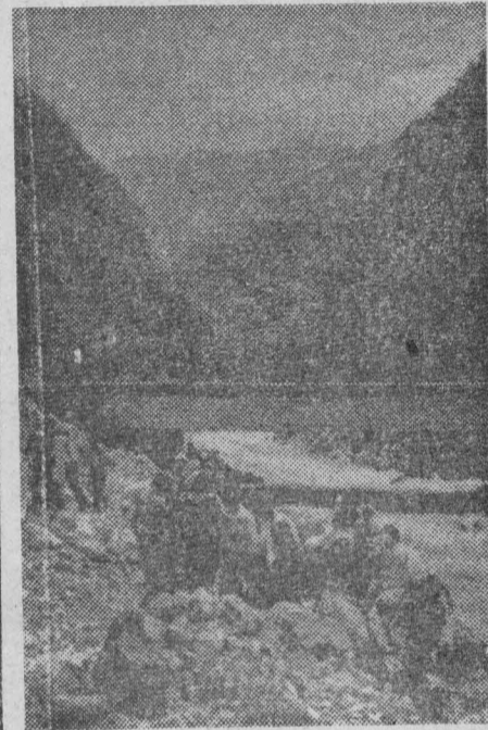
На снимках (сверху вниз): ГАРРЫ. Пальмовая аллея Гагрского парка; РИЦА. Мост через реку Тегу по дороге на озеро Рица.