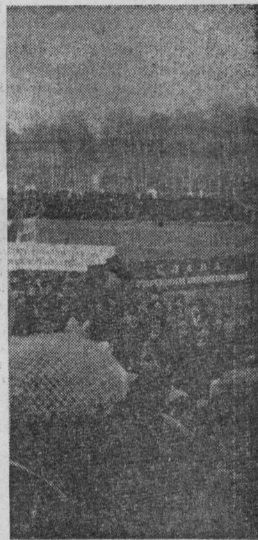
На снимках: сверху — шествие молодежи, внизу — партийное собрание приветствуют пионеры.