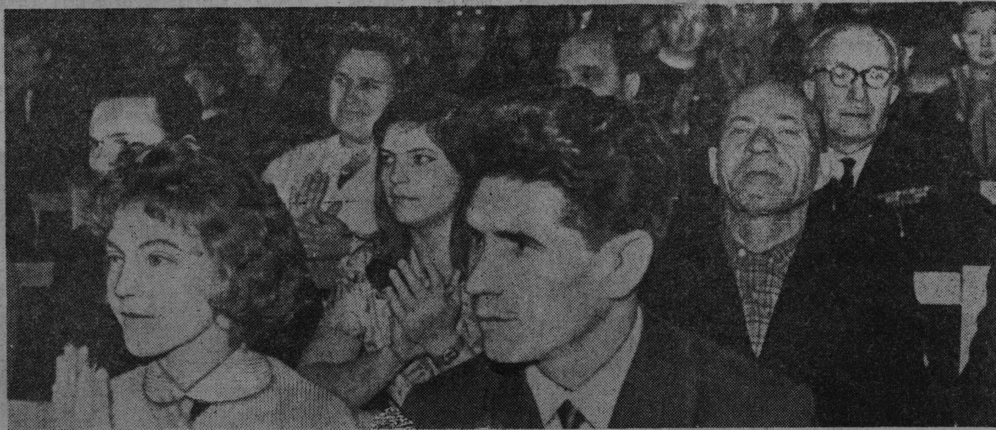
5 ноября в ЦК состоялось городское торжественное заседание, посвященное 49-й годовщине Октября. На снимке: в Большом зале Дворца.