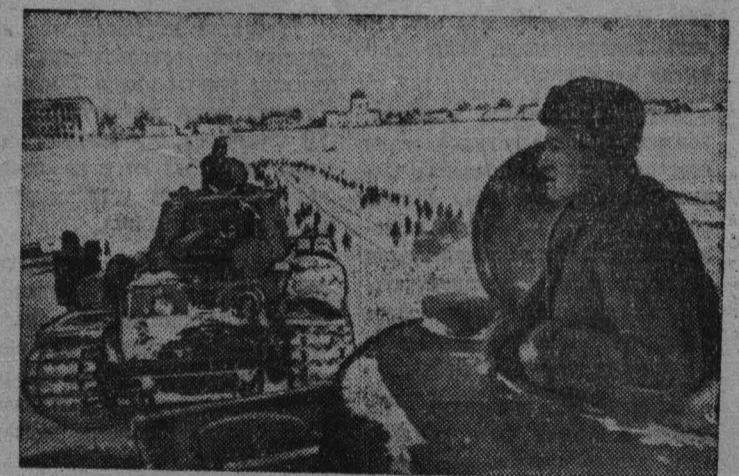
Калининский фронт. Тяжелые танки переходят реку Волгу по льду в районе освобожденного от гитлеровских оккупантов города Калинина (январь 1942 года).

Ночь оказалась союзником танкистов. Первым, прикрываясь темнотой, шел танк Керученко, в котором находился командир роты. На большой скорости машины проскочили заминированный мост и, громя гусеницами, помчались дальше. Огонь танковых пушек и пуле-