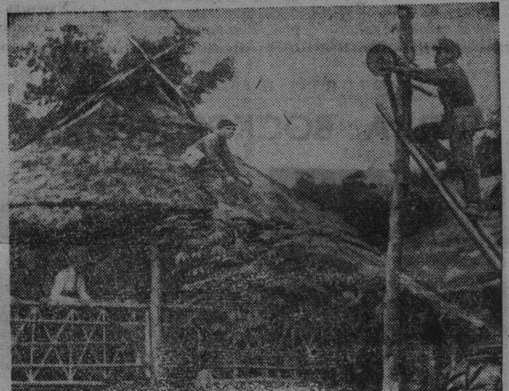
ДЕМОКРАТИЧЕСКАЯ РЕСПУБЛИКА ВЬЕТНАМ. В деревню Бан Лау на северо-западе страны пришло электричество. На снимке: установка наружного освещения на улицах деревни.