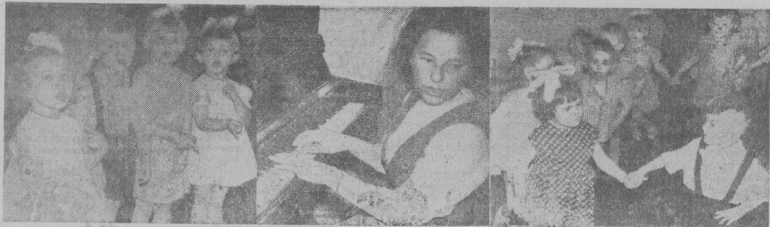
29 апреля в санаторном детском саду № 18 прошел утренник. «Спасибо родной партии за счастливое детство!» — с такими словами вышли дети давать свой первомайский концерт. Они спели песню про веселый праздник весны.