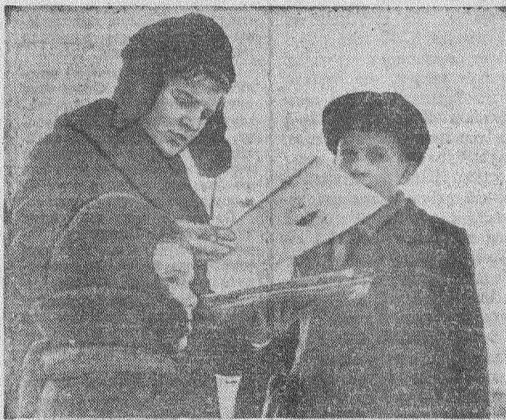
Идет Всероссийский месячник книги