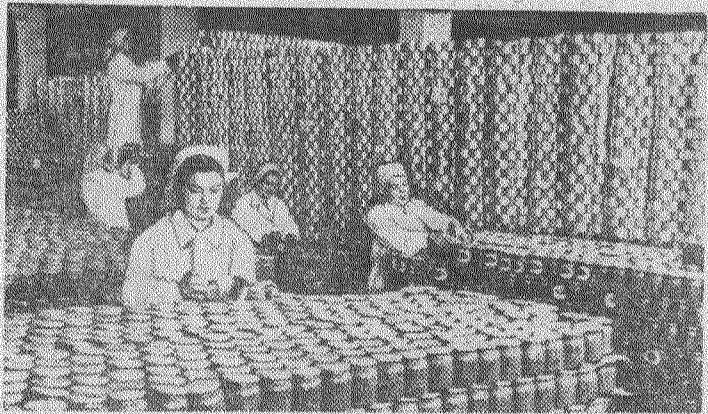
РУМЫНСКАЯ НАРОДНАЯ РЕСПУБЛИКА. Бухарестский консервный завод «Флора» один из крупнейших в стране. Ежегодно здесь перерабатываются сотни тонн овощей и фруктов. Продукция этого завода пользуется большим спросом как в самой Румынии, так и за рубежом. НА СНИМКЕ: сортировка консервов на заводе «Флора».

С начала года и до 31 октября план добычи угля выполнен на 101,9 процента. Шахтеры дали сверх плана 1 миллион 522 тысячи тонн угля. Центральный Комитет КПЧ выражает благодарность шахтерам и всем работникам шахт и трестов за самоотверженный героический труд.