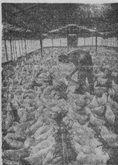
Работники сельского хозяйства Республики Куба усиленно трудятся над увеличением производства продукции полеводства и животноводства. Многие хозяйства достигли значительных успехов. На снимке: в птицеводческом хозяйстве. Здесь содержится 20.000 цыплят.

Быстрыми темпами идет сооружение цеха серной кислоты, мощностью 30 тысяч тонн в год на заводе цветных металлов в городе Мунпхене.