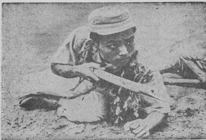
Народ Индонезии полон решимости добиться освобождения Западного Ириана. «Голландские колонисты должны уйти с исконной индонезийской земли» — требуют жители страны трех тысяч островов. Молодые добровольцы обучаются военному делу. На снимке: доброволец на занятиях.

Президент подчеркнул, что подавляющее большинство народа Западного Ириана горячо стремится к воссоединению со свободной частью страны.