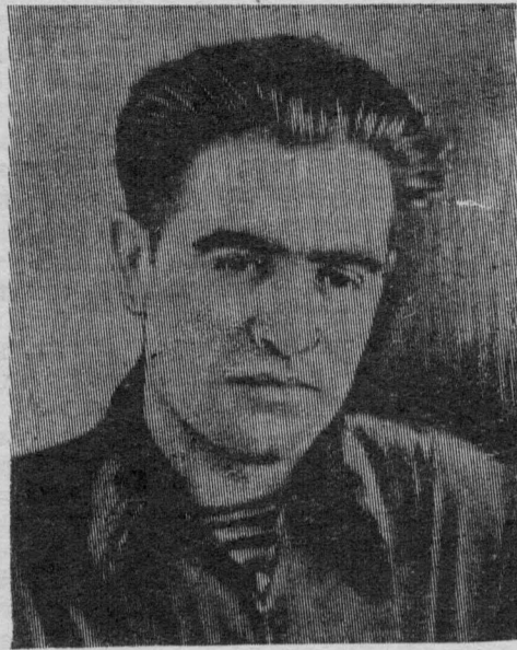
На шестом подготовительном участке шахты «Полысаев-