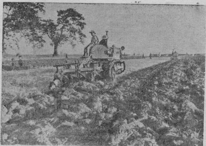
Сельское хозяйство Демократической Республики Вьетнам оснащается техникой. Недавно в деревню Йен-Со близ Ханоя прибыли тракторы.

Под крупным заголовком «Октябрьская революция показала человечеству светлый путь мира и дружбы между народами, путь строительства коммунизма» албанские газеты опубликовали доклад члена Президиума и секретаря ЦК КПСС А. Б. Аристова о 42-й годовщине Великой Октябрьской социалистической революции. В передовой статье «Слава Великому Октябрю!» газета «Зери и популлит» отмечает, что идеи Великого Октября воодушевляют трудящихся