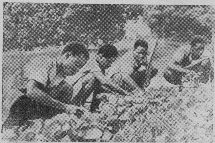
Гвинейская Республика. Учащиеся сельскохозяйственной школы близ Маму на занятиях.

В чем же причина такого отставания Америки от Советского Союза? Этот вопрос все чаще можно встретить на страницах иностранной прессы, которая пытается дать на него ответ. «Удачный запуск третьей космической ракеты, объясняет своим читателям французский бюллетень «Перспектив экономик», ровно через два года после не менее успешного запуска первого русского спутника Земли и через несколько недель после запуска ракеты, достигшей Луны, неопровержимо доказывают превосходство одной системы над другой». К этому выводу приходит и финская газета «Кансан Уутисет». «Социалистическая система, признает она, оказалась более способной к быстрейшему решению больших задач». В многочисленных откликах зарубежной печати подчеркивается, что открытая советской наукой эра межпланетной навигации имеет большое значение для будущего человечества.