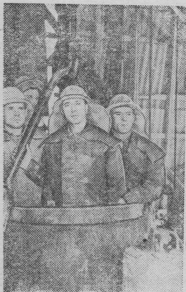
Казахская ССР. К западу от Караганды, в недрах сопки Коунур-Тюбе, геологи обнаружили большие запасы коксующегося угля. Здесь развернулось строительство крупных угольных шахт. В районе рабочего поселка Тентек в настоящее время