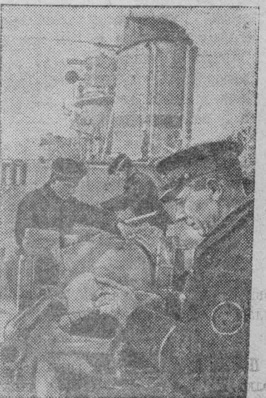
Торпеды крейсера «Н» готовят торпедный аппарат перед выходом на боевую операцию.