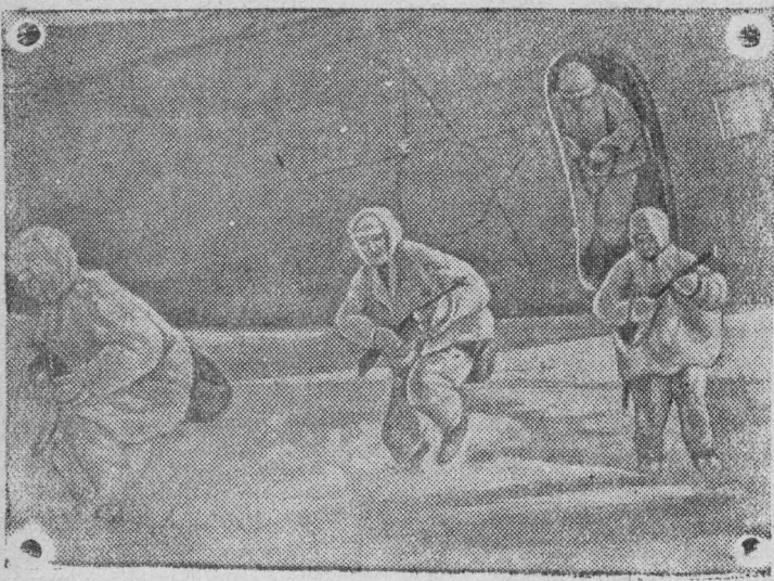
Высадка десантного отряда автоматчиков.