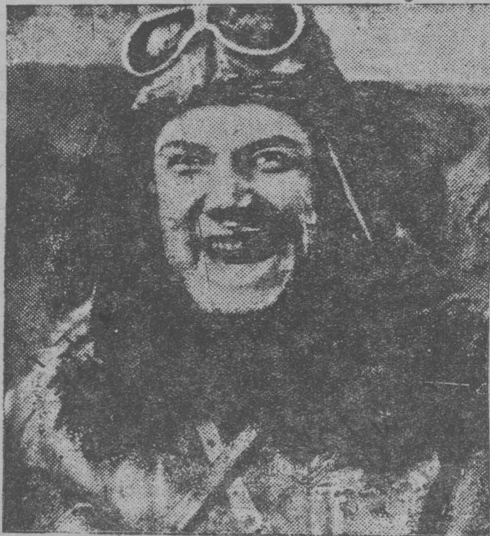
КАДР ИЗ ФИЛЬМА „АЭРОГРАД“

Герой фильма Глушак всех учит преданности родине и готовности защищать социалистическое строительство от врагов извне и внутри. Картина учит быть бдительными. Изменник родины Худяков заслуживает такого конца, какой показан в фильме.