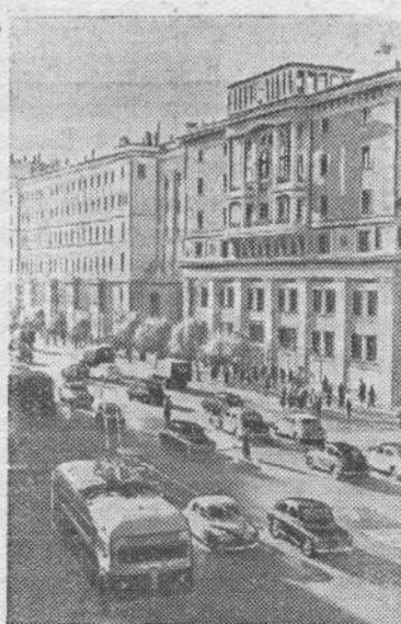
Москва сегодня. Улица Горького.

Царскому правительству удалось потопить в крови вооружен-