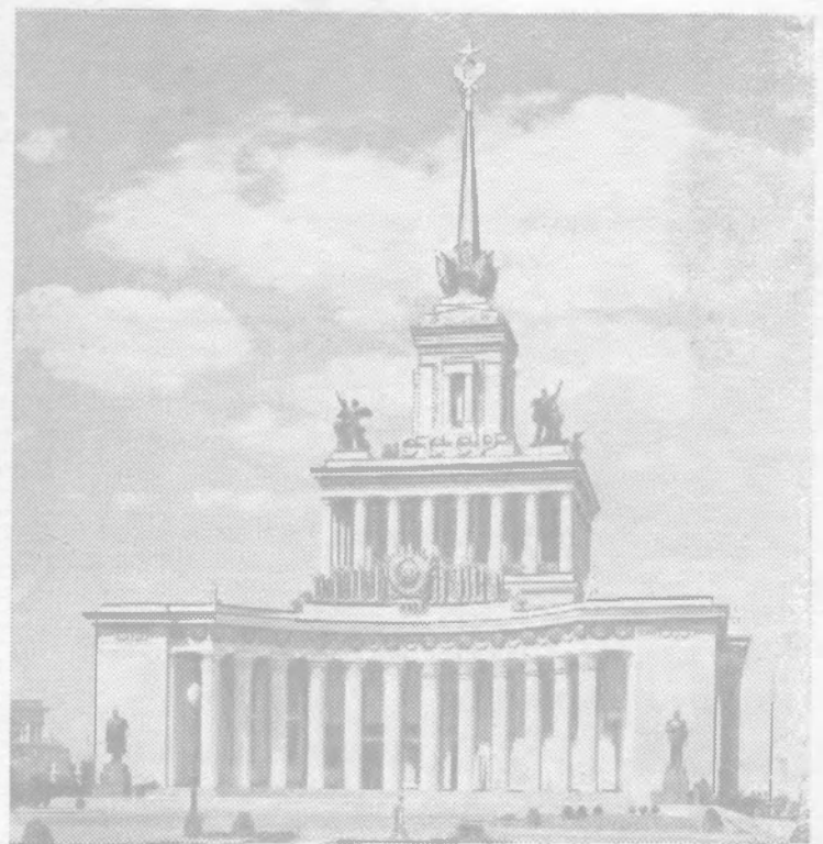
Москва. Всесоюзная сельскохозяйственная выставка. Главный павильон (вид со стороны главного входа).