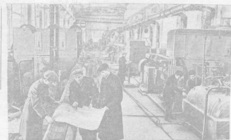
Алтайский край. На заводе «Алтайсельмаш» заканчивается монтаж автоматических линий, на которых будут изготавливаться лемеха и отвалы к плугам. Две линии будут выпускать 2.200 тысяч лемехов и одна линия — 600 тысяч отвалов в год.

На снимке: монтаж оборудования автоматической линии.