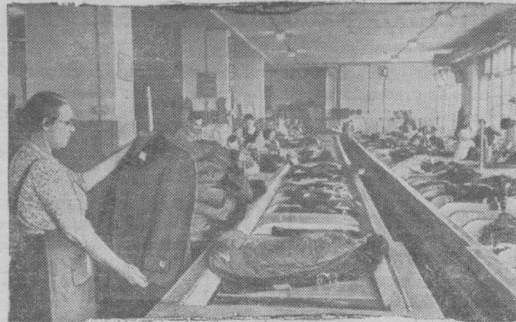
Ленинградская швейная фабрика № 1 управления местной промышленности с начала года выпустила сверх плана более 1.500 пальто и костюмов.

старший инженер отдела организации труда треста «Кагановичуголь».