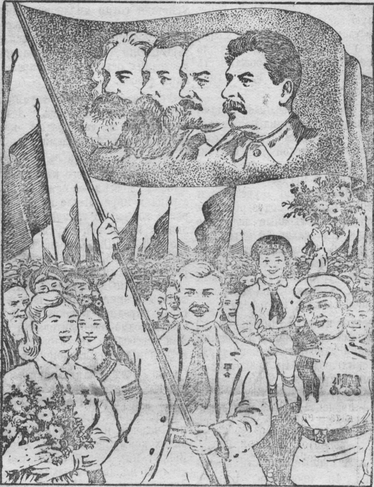
Рис. А. Морозова.