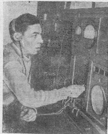
КРАСНОДАРСКИЙ КРАЙ. Из года в год увеличивается количество радиоприемников и репродукторов в колхозах.

Большое место на выставке отведено Великой Отечественной войне.