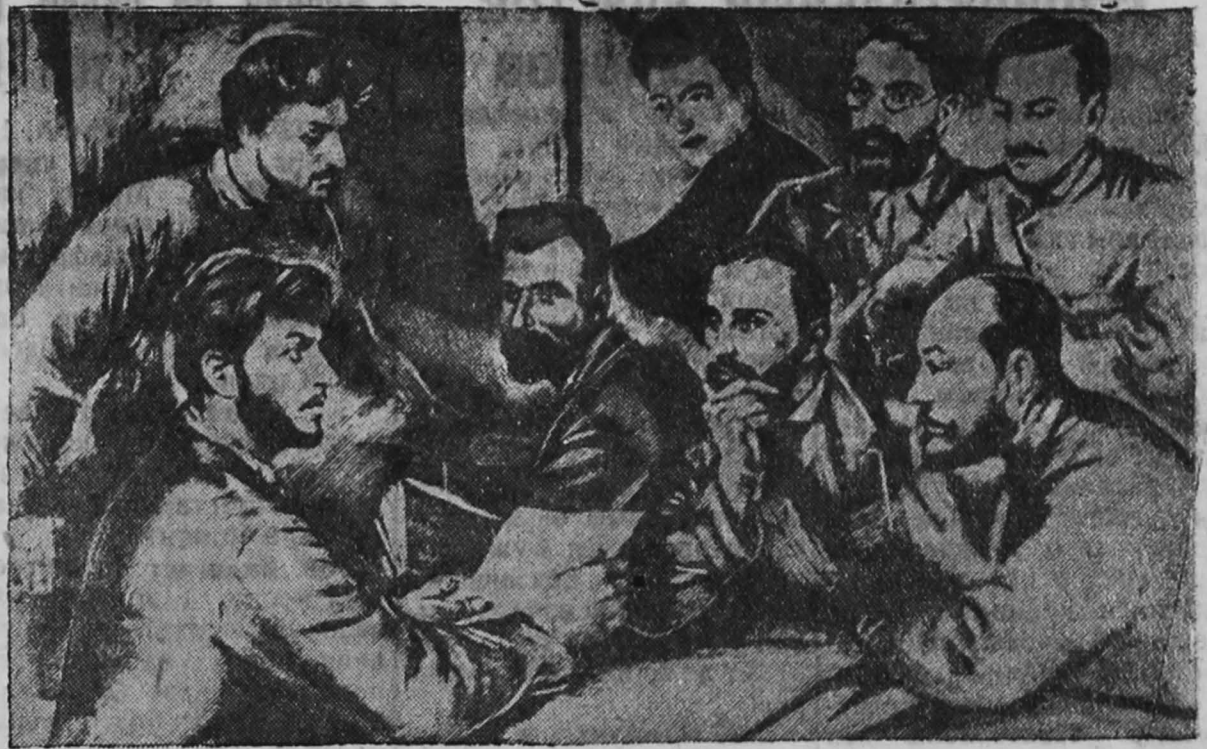
По инициативе и под руководством товарища Сталина организуется первый выборный Тбилисский комитет РСДРП (1901 г.).

„Товарищу Сталину и его товарищам приходилось руководить работой организации в тюрьме. Большевистская фракция сумела упорядочить связь с бакинской организацией, откуда получала точную информацию о текущей работе и давала ей свои советы и указания... Товарищ Сталин из тюрьмы руководил изданием органа бакинской организации—газеты „Бакинский рабочий“. Был случай, когда весь редакционный материал газеты был заготовлен в баиловской тюрьме—это был второй номер „Бакинского рабочего“.“