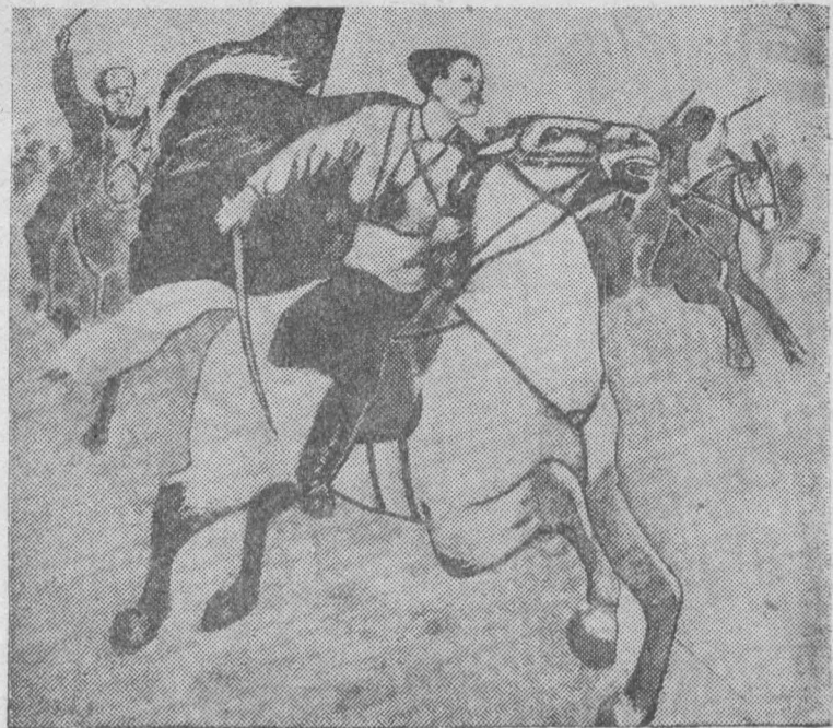
К XX годовщине Красной Армии и Военно-Морского Флота. «Чапаев в бою». Картина художника П. В. Васильева. (Центральный музей Красной Армии).