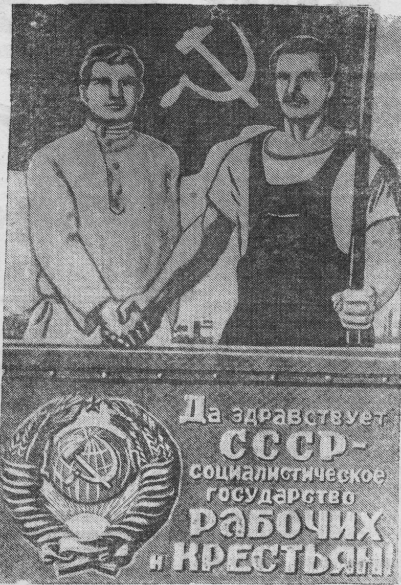
Плакат работы художника А. Кокорекина, выпущенный издательством «Искусство» к XXI годовщине Великой Октябрьской социалистической революции.