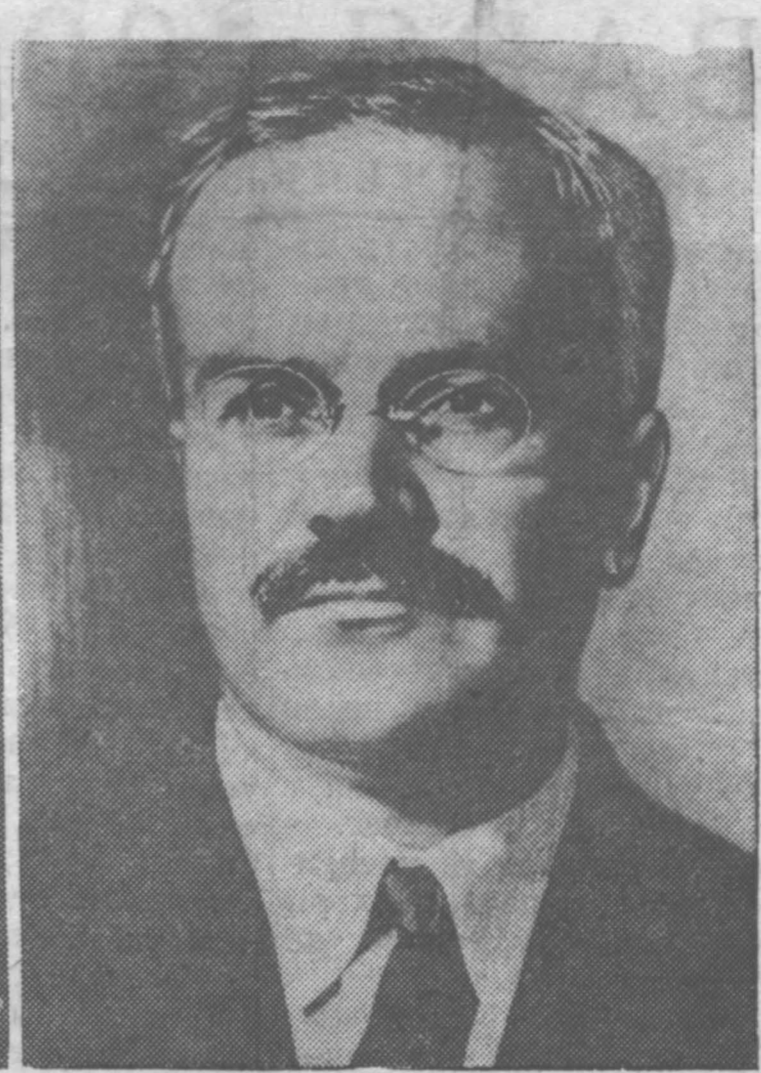
Председатель Президиума Верховного Совета СССР товарищ Н. И. Калинин .