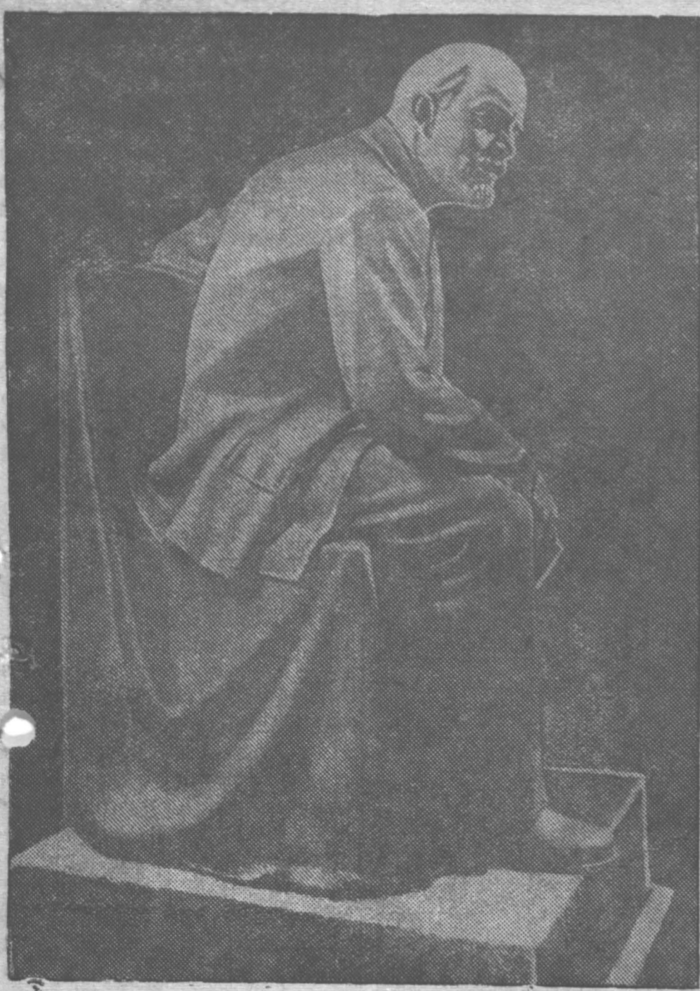
В. И. ЛЕНИН. Скульптура работы Меркурова.

Четырнадцать лет назад перестало биться пламенное сердце гения Великой пролетарской революции, вождя и учителя трудящихся Владимира Ильича ЛЕНИНА. Осуществление великих заветов Ленина обеспечило победу социализма в нашей стране. ДЕЛО ЛЕНИНА ПОБЕДИТ ВО ВСЕМ МИРЕ. ДА ЗДРАВСТВУЕТ ЛЕНИНИЗМ!