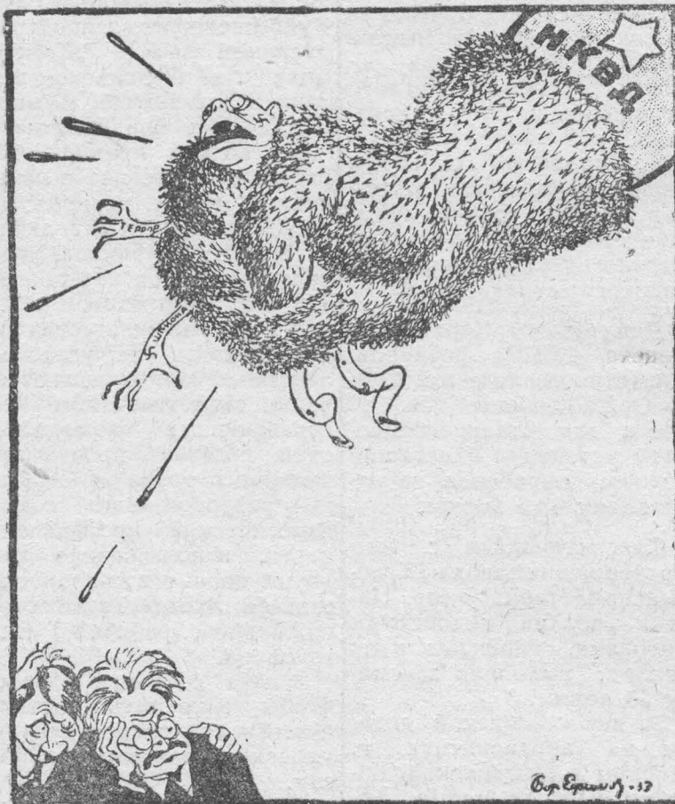
Рис. Б. Ефимова. („Известия“).