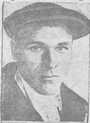
Стахановец шахты № 1-2 т. Жданов

Руководители шахт, секретари парткомов должны немедленно собрать лучших людей, стахановцев, мастеров угля, ударников и разъяснить им, о том тяжелом положении в котором очутился рудник за первые дни сентября. Надо немедленно совместно со стахановцами, управляющим, главным инженерам, начальникам участков, добиться перелома в работе рудника, давать систематически такую добычу угля какую давали в последнюю декаду августа.