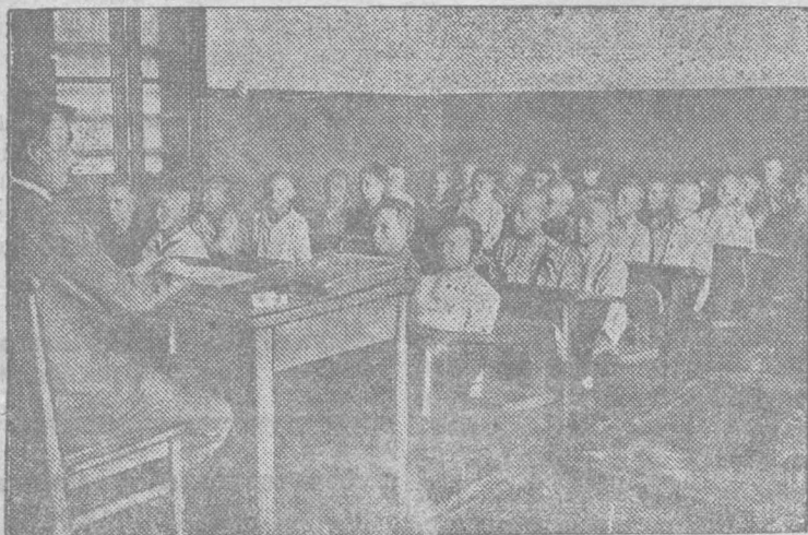
Ученики 1-го класса Киселевской школы № 16 на уроке