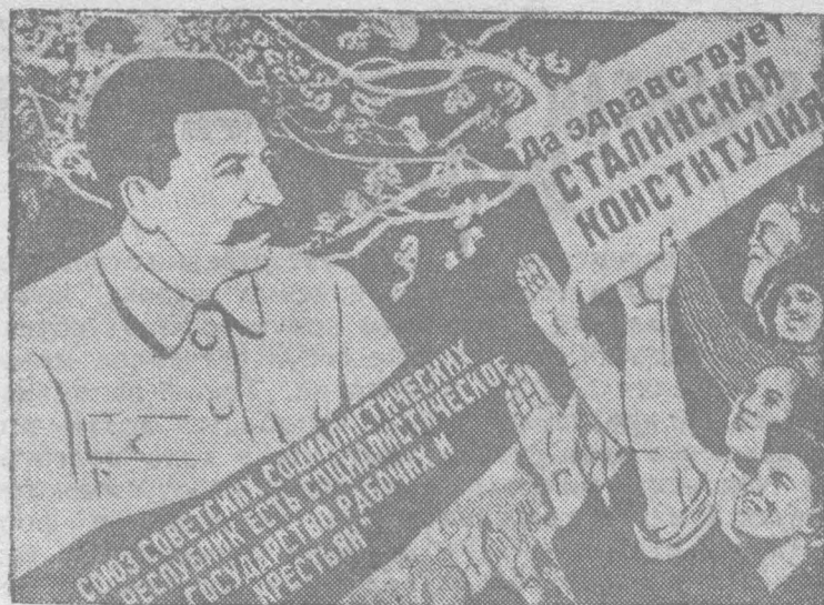
Плакат Изюгаза работы художников Дени и Долгоруксва: „Да здравствует Сталинская Конституция“. Этот плакат выпускается также на узбекском, таджикском, казахском, якутском, кара-калпакском и других языках народов Союза ССР.