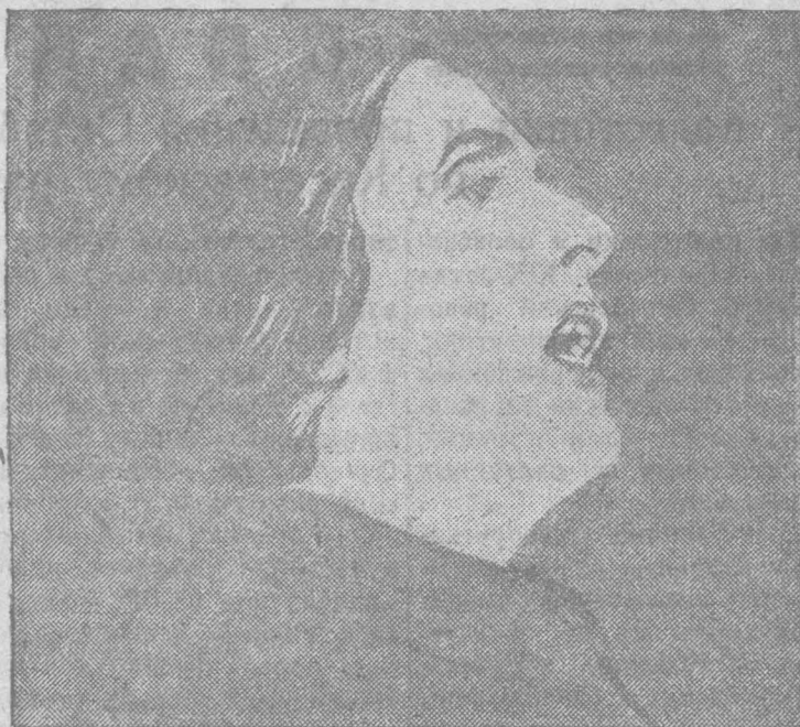
Долорес Ибаррури (Пасионария) (член политбюро коммунистической партии Испании) выступает на митинге.