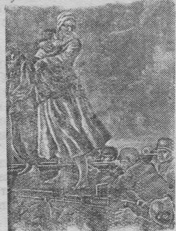
Выставка «Великая отечественная война» в Государственной Третьяковской галерее.

На Северном Кавказе наши войска, преодолевая сопротивление противника, успешно продвигались вперед. Немцы пытались задержаться на одном выгодном рубеже, чтобы привести в порядок разбитые части, но были опрокинуты ударом наших танковых и кавалерийских частей. Бойцы Н-ской кавалерийской части, преследуя отступающего противника, истребили более 200 гитлеровцев, захватили 7 орудий, 30 автомашин и 4 склада с продовольствием. Другая наша часть разгромила батальон вражеской пехоты и захватила 4 автоматических пушки, 4 миномета, 47 автомашин и другие трофеи.