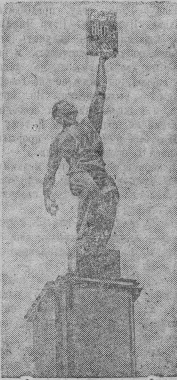
НА СНИМКЕ: Скульптура, установленная у павильона Печати.

На Всесоюзной сельскохозяйственной выставке в Москве.